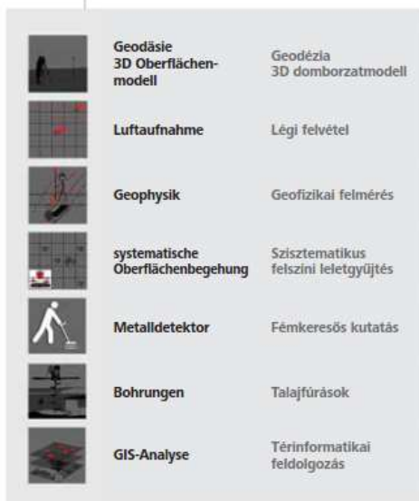
1. ábra. A roncsolásmentes kutatási csomag elemei

1. Geodéziai felmérés, melynek eredményeként 3D domborzatmodellt generálunk az adott területről. Ez adja a szakadatok térképezésének alapját. 2013 előtt a modellhez szükséges adatokat hagyományos földi mérőállomás, azt követően fotó 3D eljárás segítségével állítjuk.